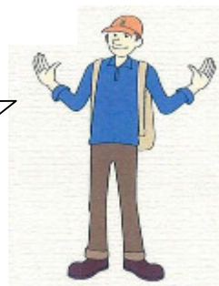
えんでこキャラクター てくてくん

「えんでこ」は 大人の楽しい遠足です!! 様々なコースをご用意して、 皆さまのご参加を お待ちしております。