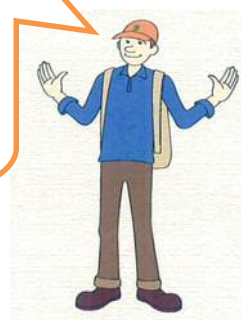
えんでこキャラクター てくてくん